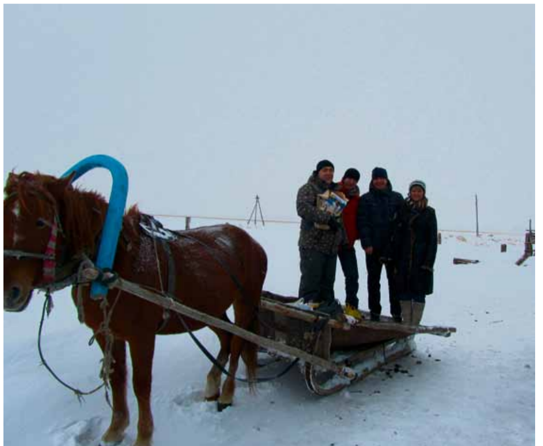
Tiimit kulkivat kylästä kylään monin eri tavoin.