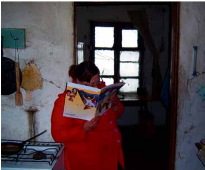
Evankelioiva kirjallisuus kiinnosti.

– He keskustelivat mielellään kanssamme ja kertoivat missä asuivat sekä millä luokalla olivat koulussa, tiimin jäsenet kertoivat. – Heitä kiinnosti, mitä lehtiä meillä oli kädessämme. Kerroimme heille Jumalasta ja Jeesuksesta, Jumalan rakkautesta ja anteeksiannosta. Kaikki kahdeksan poikaa ottivat Jeesuksen vastaan Herranaan ja Pelastajanaan.