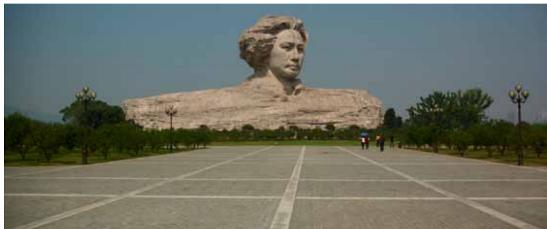
Puhemies Mao Zedongia jumaloidaan Kiinassa edelleen. Tämä valtaisa nuorta Mao esittävä patsas hakattiin kalliioon Maon syntymäkaupungissa Changshassa, Hunanissa, kun hänen syntymästään oli kulunut 110 vuotta 2003.

Olemme Avainmediana olleet erityisasemassa, kun olemme saaneet Kiinassakin kulkea kotiseurakunnan rinnalla Jumalan ennalta valmistamissa teoissa. Olemme auttaneet heitä saamaan Raamattuja ja opastaneet median avulla tavoittamaan tuon suuren maan kansaan eri puolilla. Tuo työ on edelleen kesken, ja saakoon Jumala edelleen syyttää meidät kulkemaan Kiinan sisärieni ja veljien