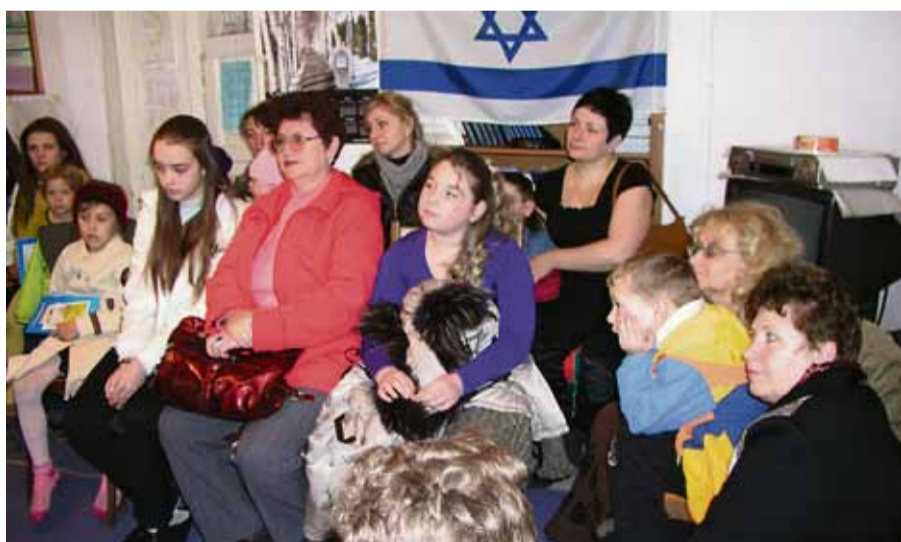
Bishkekissä on voitu pitää tilaisuuksia ja julistaa pelastussanomaa, mutta avointa alttarikutsua ei ole toistaiseksi esitetty maan uskontolain keskeneräisyyden vuoksi, jotta viranomaiset eivät pääsisi esittämään sanktioita seurakunnalle.

rakkauden osoittaminen onkin se tehokkain tapa välittää sanomaa Messiaasta hajaannuksessa elävälle Jumalan omaisuusmaksalle.