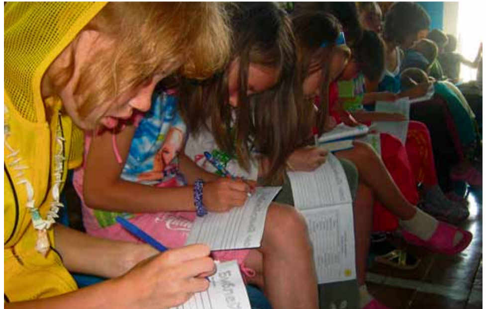
Tytöt tekemässä muistiinpanoja lastenleirillä.

Kominkielinen Lastenraamattu on valmistumassa, ja sen käyttöönotto Kominmaalla ajoittuu tulevan tammikuun alkuun eli Venäjällä 7.1. vietettävän joulun aikoihin. Kirjan painos on 5 000 kpl.