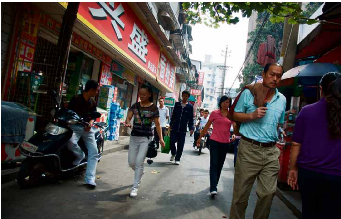
Samalla kun Kiinasta on kehittymässä suurvalta, jonka vaikutus leviää kaikkialle maailmaan, kristillisyyden vaikutus Kiinassa on lisääntymässä.

Kiinan-työtä voit tukea viitteellä 1 40009.