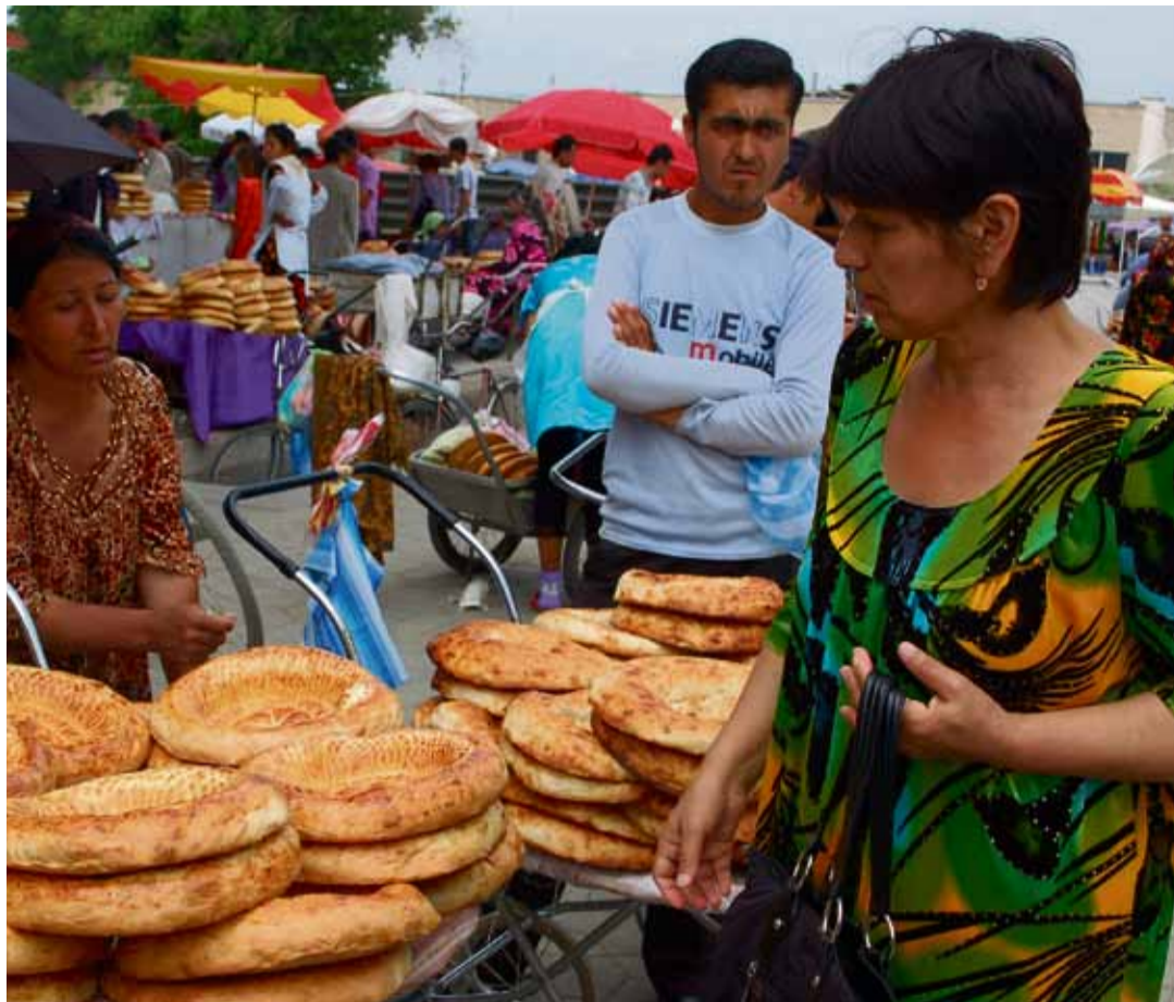
Torielämää Keski-Aasian Uzbekistanissa.

– Turkmenistanissa nousee lautasantenneja kuin sieninä saateella, mutta jos halutaan nähdä ohjelmia, jotka on tuotettu suoraan omalla äidinkielellä, ei vallinnanvara ole paljon. Joko on katsottava valtiollisen television propagandaohjelmia tai sitten Kanal Hayatia. Muuten on