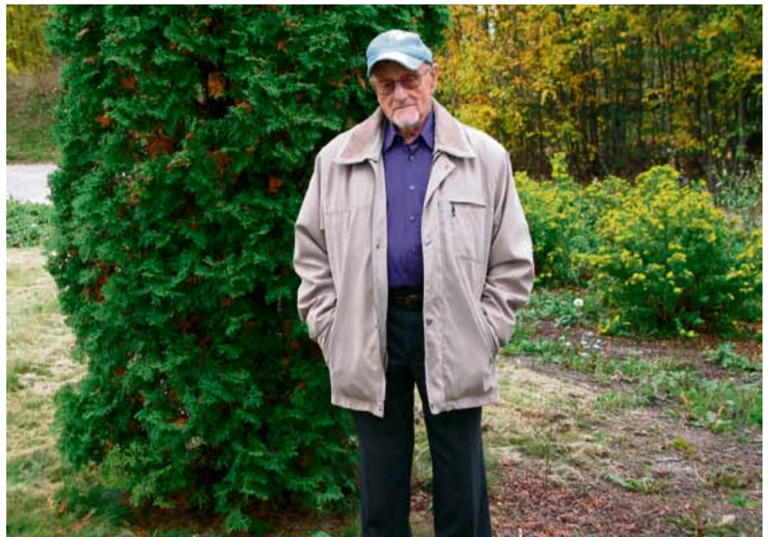
Pavel tuntee velvollisuudekseen kertoa holokaustista niidenkin puolesta, jotka eivät kykene siihen.