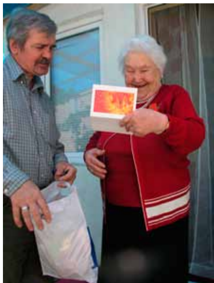
Vierailut juutalaisten luona ovat tuoneet iloa niin kävijöille kuin käyntien kohteillekin.

IVY:n juutalaistyön yksi ominaispiirre on se, että messiaanisten seurakuntien jäsenistö ei ole kovin pysyvää. Uskoon tulleet ja seurakuntaan liittyneet juutalaiset muuttavat usein pois.